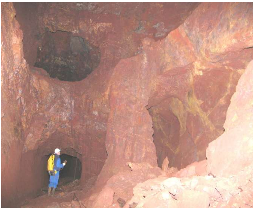
Figure 5 : surveillance par inspection visuelle des mines de fer de Normandie, risque d'effondrement sous habitations

Ces missions permettent d'éviter l'inondation des cuvettes d'affaissement, de surveiller les zones d'échauffement dans les terrils en combustion, de maîtriser les risques liés au gaz de mine dans les bassins en cours d'ennoyage, de surveiller l'évolution mécanique des cavités minières situées en-dessous d'enjeux (Fig. 5), de contrôler la qualité des eaux minières rejetées et de faire fonctionner des stations de traitement de ces eaux lorsqu'elles ont été requises. La diversité des ouvrages et des objets surveillés ainsi que la complexité des situations illustrent l'importance de cette mission que l'Etat a confié au BRGM (cf. http://dpsm.brgm.fr ).