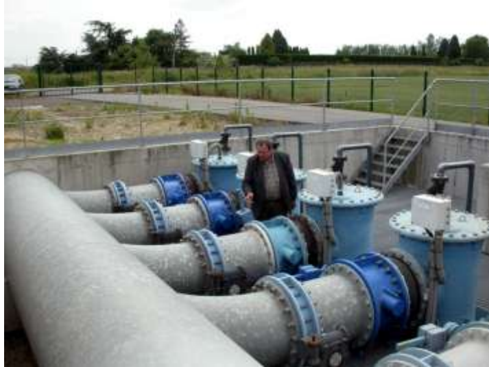
Figure 4 : Station de relevage des eaux de la Scarpe dans le Bassin Houiller du Nord et du Pas de Calais

Ces missions permettent d'éviter l'inondation des cuvettes d'affaissement, de surveiller les zones d'échauffement dans les terrils en combustion, de maîtriser les risques liés au gaz de mine dans les bassins en cours d'ennoyage, de surveiller l'évolution mécanique des cavités minières situées en-dessous d'enjeux (Fig. 5), de contrôler la qualité des eaux minières rejetées et de faire fonctionner des stations de traitement de ces eaux lorsqu'elles ont été requises. La diversité des ouvrages et des objets surveillés ainsi que la complexité des situations illustrent l'importance de cette mission que l'Etat a confié au BRGM (cf. http://dpsm.brgm.fr ).