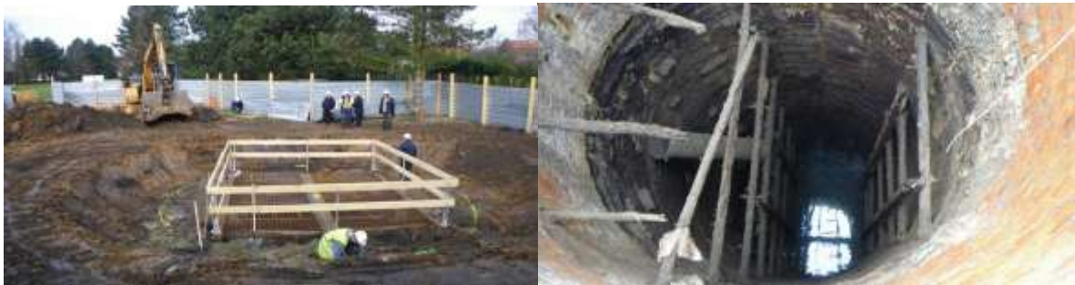
Figure 3 : travaux de mise en sécurité du puits n°1 d'Annezin (Pas de Calais)

Il s'agit par exemple de travaux de fermeture d'accès débouchant au jour (Fig. 3), de confortement d'anciens travaux, de gros entretiens sur des installations de sécurité, de traitement des désordres (fontis).