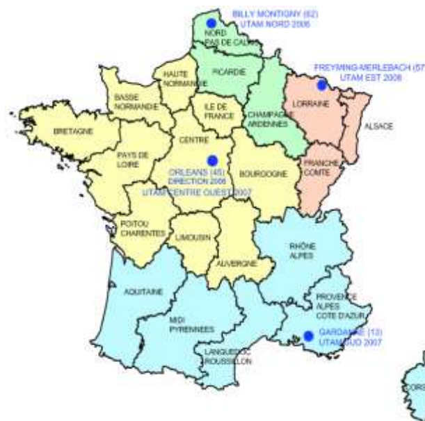
Figure 2 : localisation des 4 UTAM

Pour réaliser ces missions le BRGM a créé le 1 er mai 2006 le Département Prévention et Sécurité Minière (DPSM). Le DPSM dispose d'un effectif de 104 agents (données 2011) répartis sur 4 Unités Territoriales Après-Mine (UTAM) (Fig. 2)