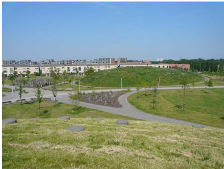
Figure 3 : Photo d'un parc du quartier de Leidsche Rijn : intégration de terres polluées confinées dans le remodelage paysager urbain

La gestion de la mobilité est axée sur la création de pistes cyclables et cheminements piétons à travers l'ensemble du quartier.