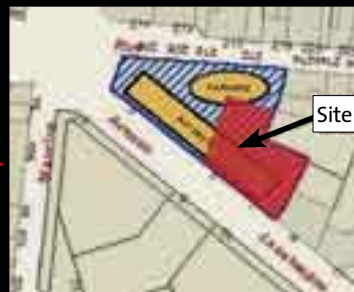
Comparaison Projet/Activités passées